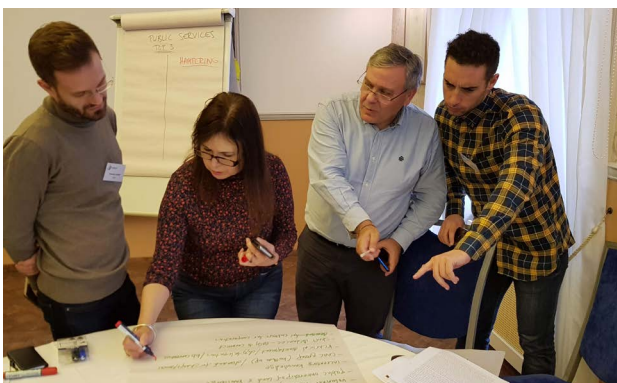
Sesión de trabajo con otros socios de ROBUST en relación a los servicios públicos de alta calidad en las áreas rurales más remotas (Riga, Letonia).

La mayor parte de la población urbana reside en la ciudad de Valencia y su área metropolitana (aunque una parte significativa en municipios intermedios). La Universidad de Valencia (UV) junto con la Federación Valenciana de Municipios y Provincias (FVMP), pretende contribuir a la resolución de los desafíos derivados del crecimiento desequilibrado, que se manifiesta entre las zonas urbanas litorales y las áreas rurales interiores de la región analizada (Provincia de Valencia). Como resultado, hay realidades territoriales, sociales, económicas y paisajísticas cada vez más complejas que deben ser gestionadas.