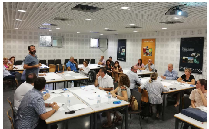
Workshop con los principales actores locales del Living Lab de Valencia (Instituto de Desarrollo Local de Valencia)